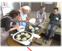
女性参加者も手際よくお好み焼きを焼いています♪

『趣味の会』とは、同じ趣味を持つ方々が、楽しく有意義な時間を過ごす自主的なクラブ活動です。北老人福祉センターでは、下記の『趣味の会』の皆さんが部屋を利用され、楽しく活動しています。趣味や生きがいをいづくりに気軽に参加してみませんか？