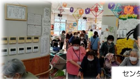
センター職員全員が協力して慌てず外に避難