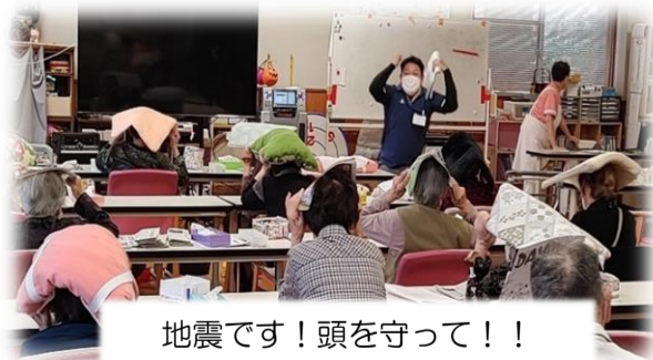
地震です！頭を守って！！

地震発生！ 厨房から出火！！ という想定で、デイサービスの利用者、そして介護事業所の職員全員が協力して行いました。介護事業所では、毎年このような地震、火災に備え訓練を行っており、他に感染症に備えた研修や訓練など行っています。