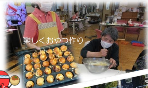
楽しくおやつ作り