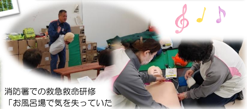
消防署での救急救命研修 「お風呂場で気を失っていたら？」など、実践現場での対応を真剣に質問していました