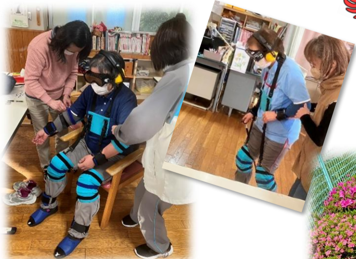
道具を借りてきて 高齢者・障がい者の体験研修をしました