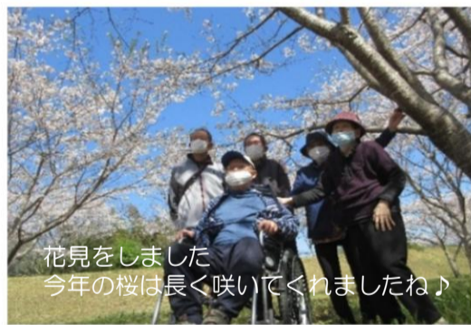
花見をしました 今年の桜は長く咲いてくれましたね！

今年度は、新たに2名のパート介護職に正職員になってもらったことで、ようやく体制が安定してきました。次は、一人一人の向上を目指して「人財育成」と「職場のさらなる活性化」をテーマに取り組みます。