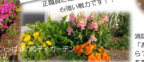
花いっぱい岡富ディガーデン